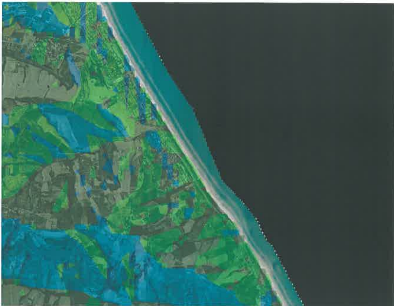
Carta Tematica 5 - Carta dell'esposizione eseguita nell'ambito di realizzazione del Piano regionale per la programmazione delle attività di previsione, prevenzione e lotta attiva contro gli incendi boschivi, art 3 L. n. 353/2000 - Anni 2011-2012. Carta tematica regionale. Verde scuro – Nord, verde chiaro – Est, blu chiaro Sud, blu scuro – Ovest.