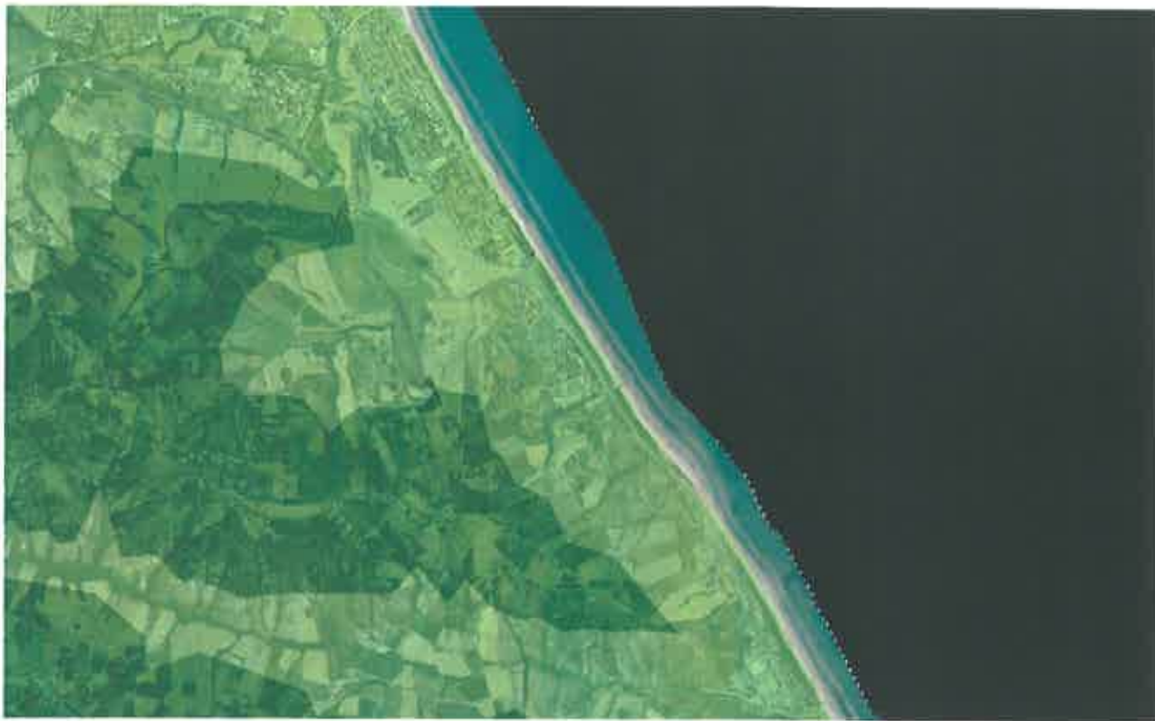
Carta Tematica 4 - Carta delle altitudini eseguita nell'ambito di realizzazione del Piano regionale per la programmazione delle attività di previsione, prevenzione e lotta attiva contro gli incendi boschivi, art 3 L. n. 353/2000 - Anni 2011-2012. Carta tematica regionale. In verde chiaro da 0 a 100 metri s.l.m.