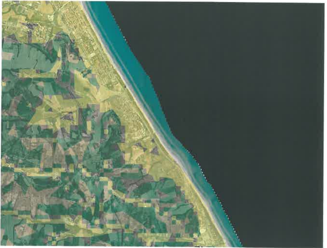
Carta Tematica 6 - Carta delle pendenze eseguita nell'ambito di realizzazione del Piano regionale per la programmazione delle attività di previsione, prevenzione e lotta attiva contro gli incendi boschivi, art 3 L. n. 353/2000 - Anni 2011-2012. Carta tematica regionale. In giallo pendenze che hanno angoli che vanno da 0° a 8° gradi.