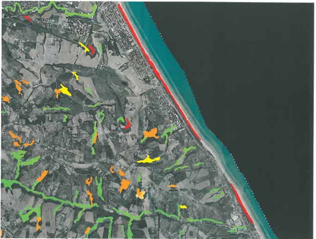
Carta Tematica 2 - Carta del rischio pirologico estivo- invernale eseguita sulla base della carta dell'uso del suolo nell'ambito di realizzazione del Piano regionale per la programmazione delle attività di previsione, prevenzione e lotta attiva contro gli incendi boschivi, art 3 L. In rosso livello di rischio molto alto.