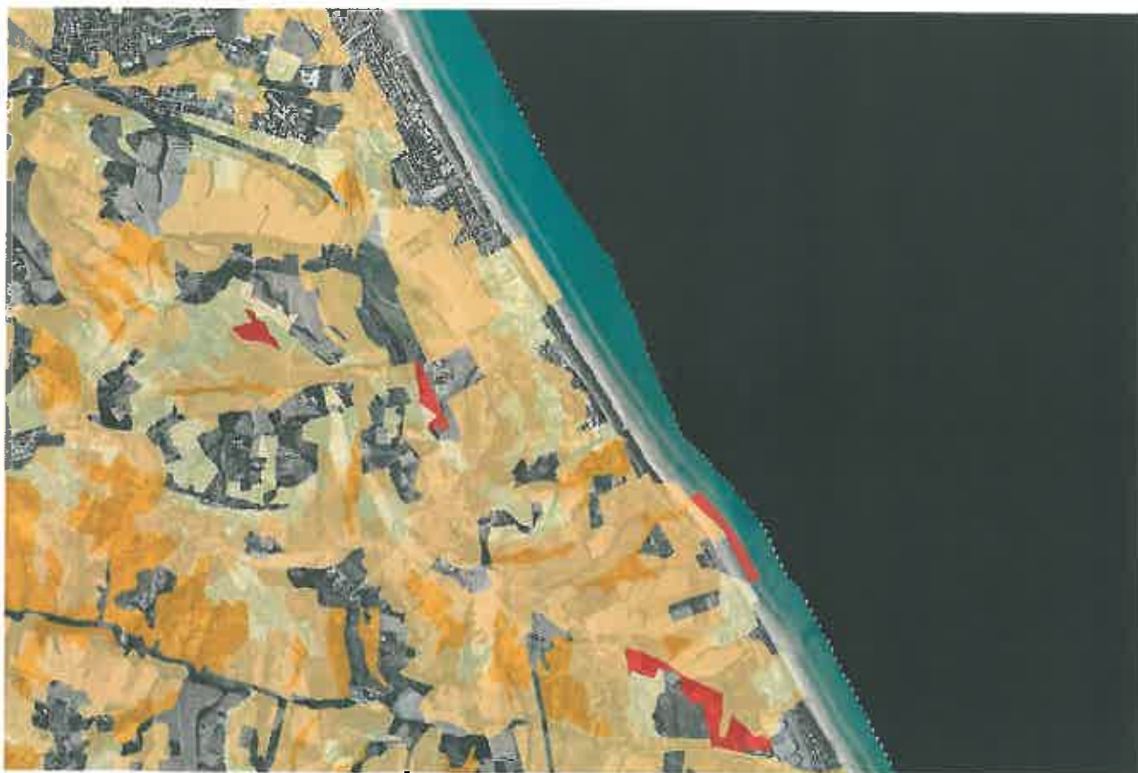
Carta Tematica 8 - Carta del rischio pirologico estivo eseguita sulla base della carta dell'uso del suolo nell'ambito di realizzazione del Piano regionale per la programmazione delle attività di previsione, prevenzione e lotta attiva contro gli incendi boschivi, art 3 L. n. 353/2000 - Anni 2011-2012. Carta tematica regionale derivata dalla classificazione di rating di elementi della carta tematica regionale dell'Uso del Suolo 2000.